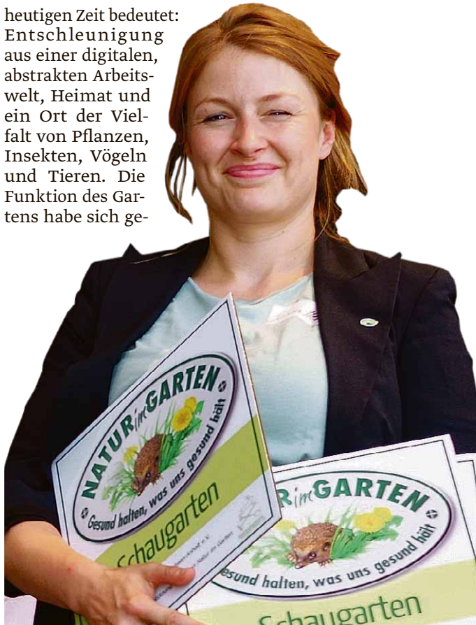
Eine Mitarbeiterin des Symposiums zeigt die Tafeln, die auf die besonderen Schau-Gärten hinweisen.

heutigen Zeit bedeutet: Entschleunigung aus einer digitalen, abstrakten Arbeitswelt, Heimat und ein Ort der Vielfalt von Pflanzen, Insekten, Vögeln und Tieren. Die Funktion des Gartens habe sich ge-